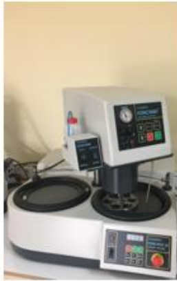
Otomatik Taşlama ve Parlatma Cihazı