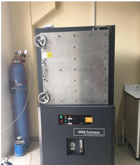
Atmosfer Kontrollü Yüksek Sıcaklık Fırını