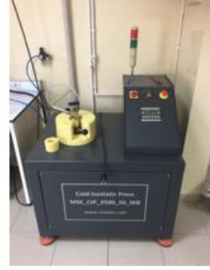
Soğuk İzostatik Pres