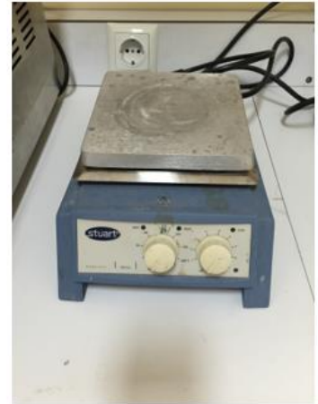
Isıtıcılı Manyetik Karıştırıcı